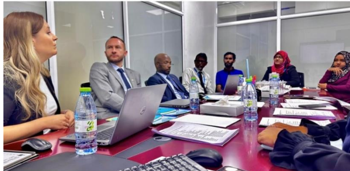
Highlights from the 2023 Annual Review Meeting between Cambridge Assessment International Education and Department of Public Examinations.